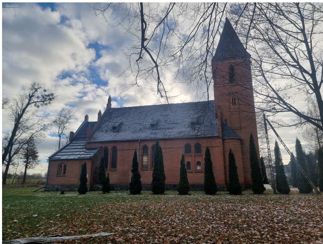
Fot. Widok – elewacja północna