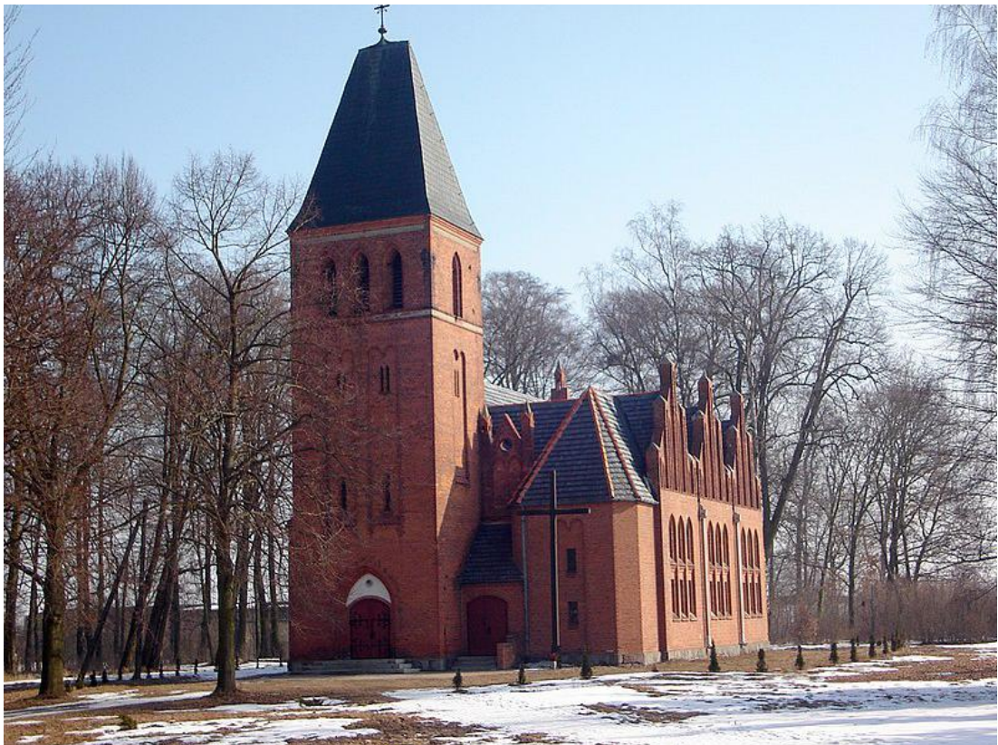
Fot. Widok – elewacja południowo-zachodnia