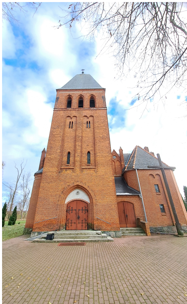
Fot. Widok – elewacja zachodnia (frontowa)