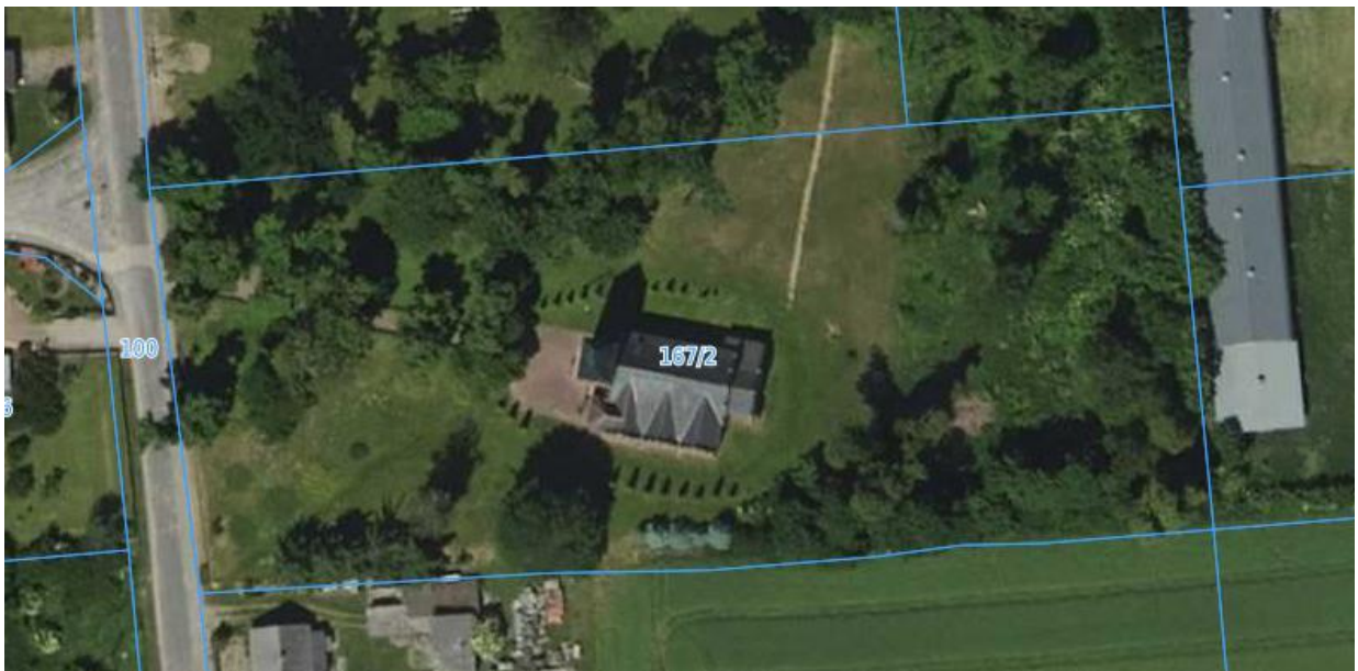
Fot. Działka będąca przedmiotem opracowania – widok z góry

Zakresem dokumentacji objęty został budynek kościoła rzymskokatolickiego pw. Świętych Józefa i Kazimierza we Włóściborzu, dz.nr 167/2, gmina Sępólno Krajeńskie, powiat sępoleński, woj. kujawsko-pomorskie.