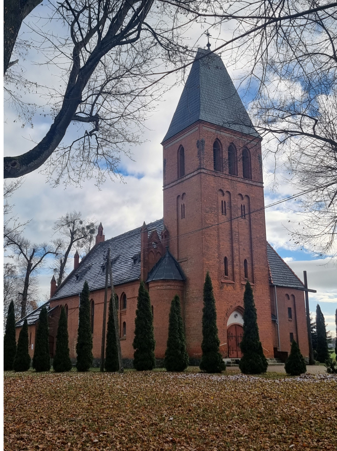
Fot. Widok – elewacja zachodnia (frontowa)