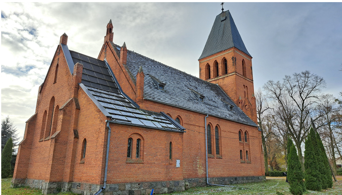
Fot. Widok – elewacja północno-wschodnia