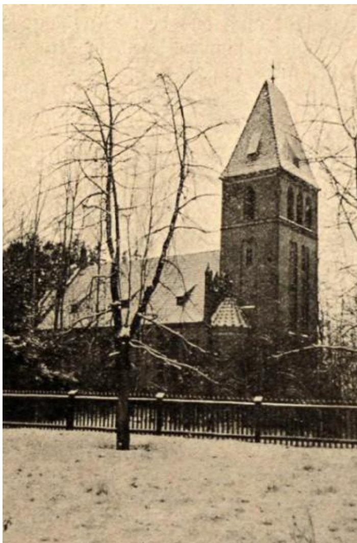
Fot. Elewacja boczna, ok. 1910-1915 r.

Obiekt został wpisany do rejestru zabytków województwa kujawsko-pomorskiego pod numerem A/1775 decyzją z dnia 04.06.2020r.