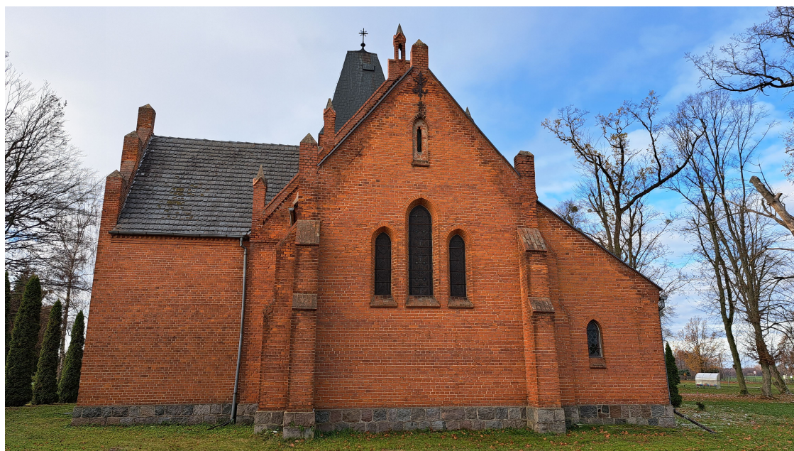
Fot. Widok – elewacja wschodnia