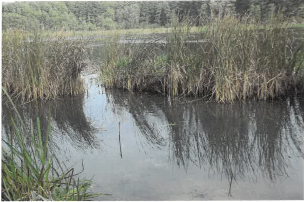
Zdj. Jezioro Niechorek