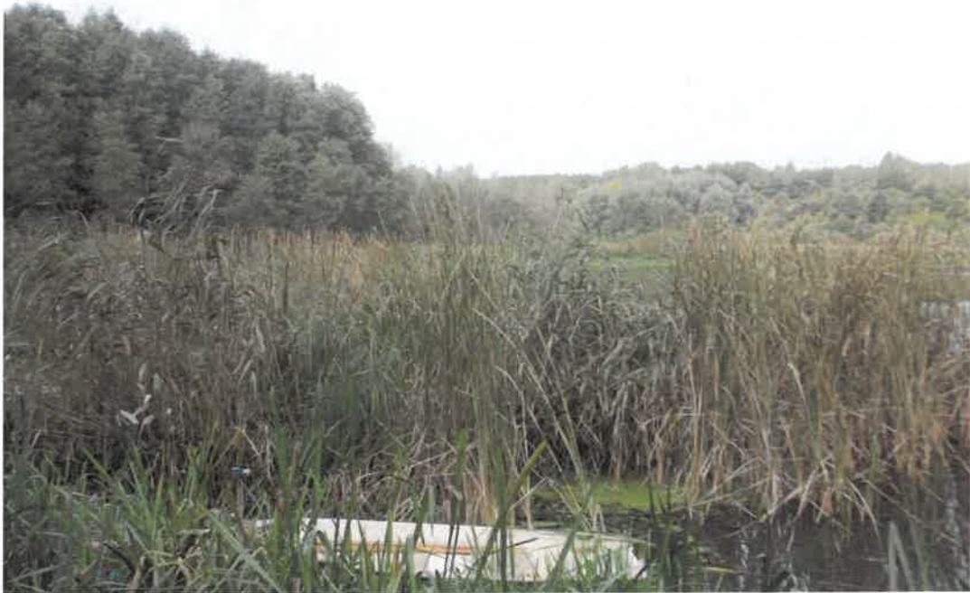
Zdj. Jezioro Niechorek