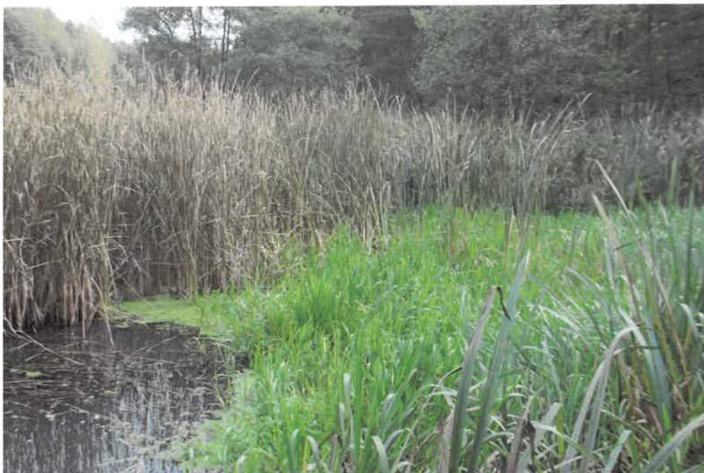
Zdj. Jezioro Niechorek