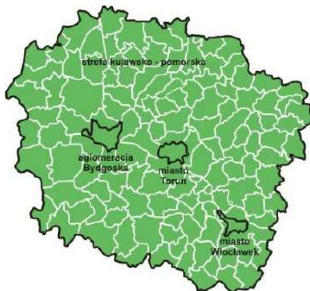
Rys. 4. Podział województwa kujawsko-pomorskiego na strefy

Pod względem spełniania kryteriów odnośnie ochrony roślin uwzględnia się: