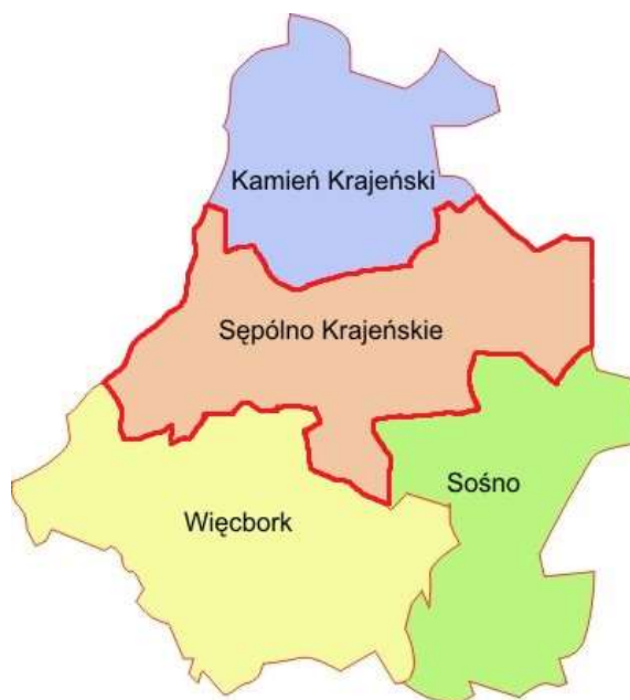
Rys. 1. Położenie Gminy Sępólno Krajeńskie na tle powiatu sępoleńskiego.